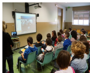
3^ Media Borgo San Dalmazzo (CN)

le, giusta e pacifica. Attraverso l'educazione, e il sistema scolastico come luogo deputato alla crescita culturale dei prossimi cittadini del mondo, promuove un progetto finalizzato alla interiorizzazione dei principi della Carta affinché ciascun