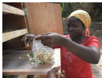
Donna che ritira la frutta e verdura essicata con l'essiccatore solare.