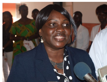
Ministro della Salute della Guinea Bissau in visita al Centro Medico Sanitario Madrugada

La missione di novembre aveva lo scopo: - creare reti turistico recettive per potenziare e far nascere la conoscenza delle bellezze del territorio. - di pubblicizzare la crema nutrizionale a livello istituzionale e controllare i risultati della formazione della missione di gennaio. E' stato possibile incontrare i Ministri della Difesa e della Sanità ma anche le donne che avevano partecipato alla formazione. - sostenere ed incoraggiare le comunità ad utilizzare i prodotti alimentari nutritivi disponibili sul territorio oppure alla loro coltivazione; - insegnare metodi e mezzi idonei alla conservazione dei prodotti alimentari.