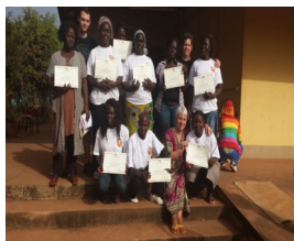
Rilascio dei diplomi ai frequentatori del corso.

L'alimentazione insufficiente è la realtà quotidiana di centinaia di milioni di bambini. Se un bambino non riesce ad ottenere tutti i nutrienti di cui l'organismo ha bisogno per il suo normale funzionamento, non solo rallenterà la sua crescita ma aumenterà anche la sua predisposizione alle malattie comuni. Ecco perché un semplice raffreddore o un attacco di diarrea possono essere letali per un bambino malnutrito. Le difese immunitarie si indeboliscono mentre aumenta il rischio di morire di polmonite, diarrea,