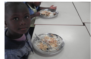
Bambini della Scuola Primaria a pranzo presso Madrugada - Guinea Bissau.