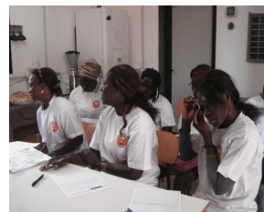
Nella foto le donne che hanno partecipato al corso di formazione.

Il CSPace Onlus, nella missione di gennaio 2015, ha guidato, in collaborazione con l'Associazione di Milano “Cuochi Senza Barriere” un corso di formazione, volto alla “conservazione e trasformazione di prodotti alimentari locali” tenutosi a Bissau – Guinea Bissau, presso la Cooperativa Medico Sanitaria Madrugada Crl.