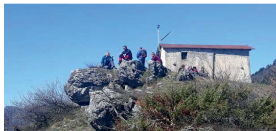
Madonna del Ronvello

Sul percorso: Chiese Madonna del Pino, di Fedio, del Ronvello, del Cornaletto e Cappella di San Rocco, sentieri delle fontane, Centrale Idroelettrica di Fedio, Specchio della Fatina, Via dell'Amicizia, Borgata Salerin, Vanet, Cascata del Pisciai.