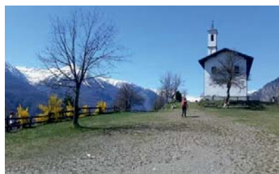
Madonna del Pino

Sul percorso: Chiese di Madonna del Pino e di Fedio, sentieri delle fontane.