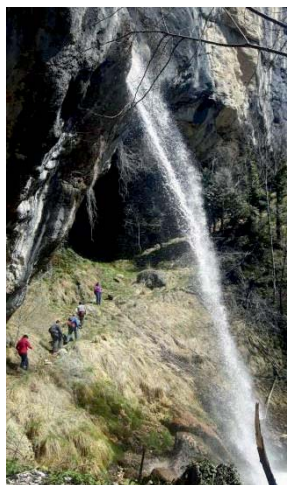
Cascata del Pisciai